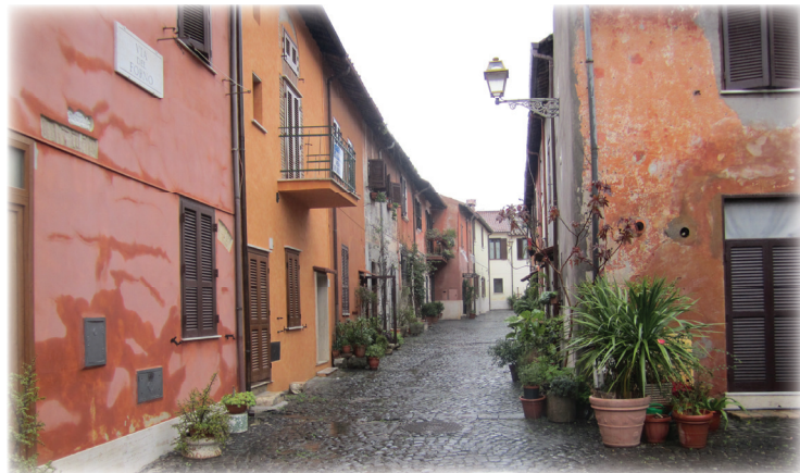
סימטה באוסטיה העתיקה

מלבד בית הכנסת העתיק באוסטיה, קיימות עדויות אותנטיות נוספות לחיים יהודיים ברומא, בדמות ה"קטקומבות" - אלו הן מערות קבורה עתיקות יומין, שעל פתחי כוכיהן צוירו תבליטים שונים של מנורות, לצד מוטיבים יהודיים נוספים, כמו לולב ושופר. גם שמות של יהודים לצד