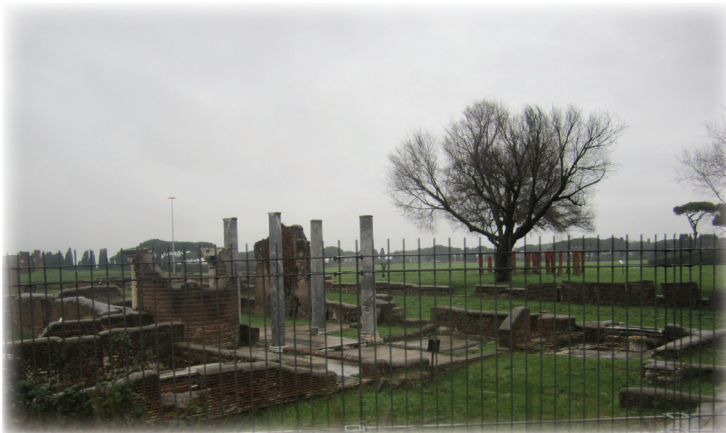
שרידי ביהכנ"ס העתיק באוסטיה

חורבותיו של בית הכנסת העתיק, שסגנונו תואם את האדריכלות בתקופת קלאודיוס-קיסר עוד הרבה קודם החורבן, נמצאות על אם הדרך בשולי הכביש הראשי המוביל מנמל התעופה "פיומיצינו" המרוחק מרומא כ- 25 ק"מ. על כותרי עמודיו של בית הכנסת מצויים תבליטים, ובהם